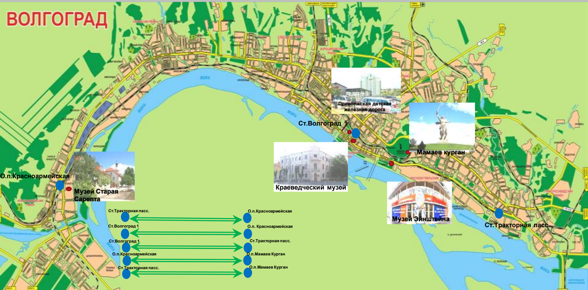
Схема экскурсионных маршрутов пригородного железнодорожного транспорта