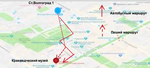
Схема движения пассажиров от станций до музеев